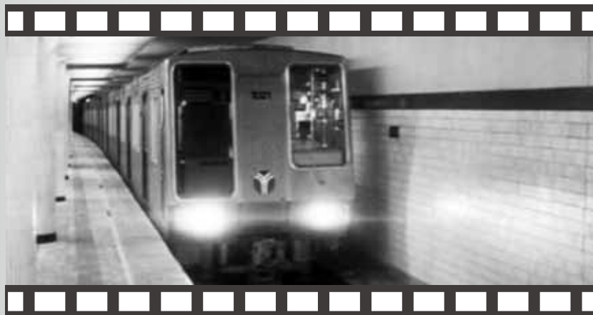
神奈川ニュース「開通する地下鉄」(1972年)

横浜市では戦後すぐから、神奈川ニュース映画協会に委託して、広報映画を作成してきました。この講座では、それらの映像資料を見ながら、横浜市の市営交通の歩みを振り返ります。